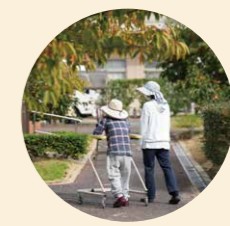
園庭での歩行訓練

理学療法士・作業療法士・言語聴覚士による入所者様・通所者様それぞれの心身機能・生活環境・ご自宅の状況に合わせたリハビリを行っています。