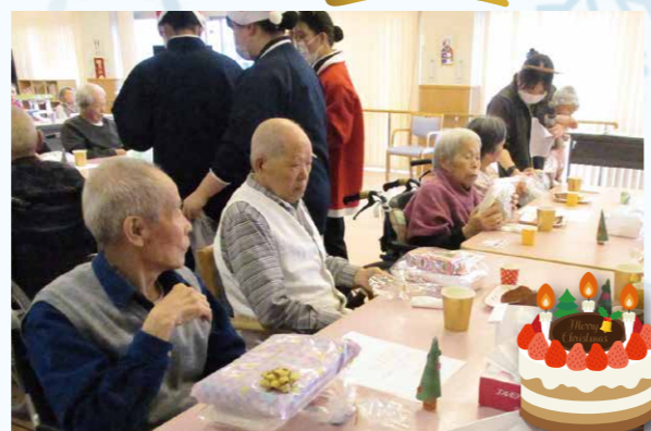
沢山のデザートや飲み物がテーブルに並びました☆