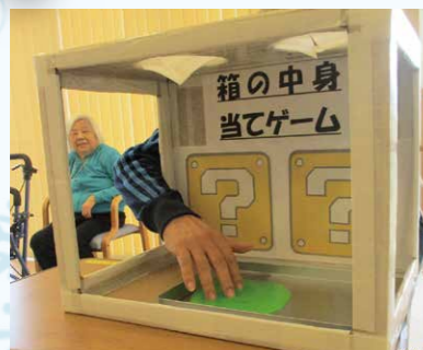
箱の中身は何だろうゲーム