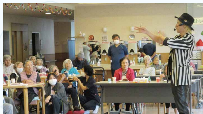
本物のマジシャンが驚きのマジックをたくさん披露して下さいました♪