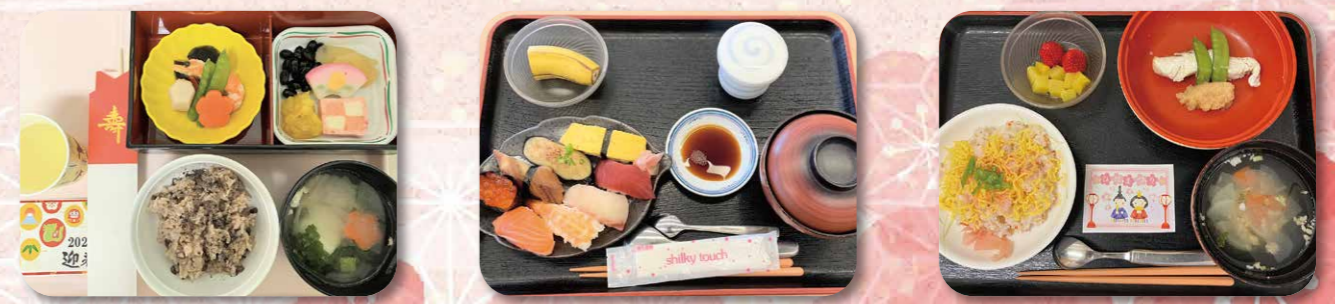
【行事食】元旦 お寿司ランチ 【行事食】3月3日

今年の節分でも赤鬼・青鬼の登場はもちろん、ひよっこもサンシャインシティではお馴染みのキャラクターとなりました。施設の庭から入ってきた鬼達は暴れ回り、ついには介護長までも連れ去ろうとしました。しかし、皆さんの元気いっぱい投げた紅白玉で追い返すことができました。最後はひよっこ踊りでみんな仲直り♪