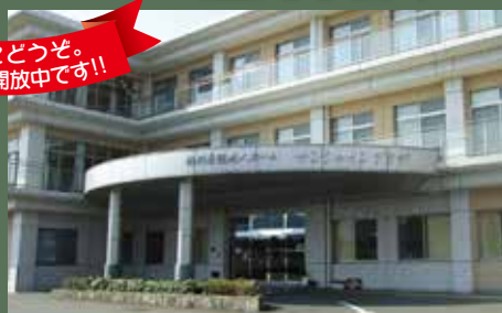
特別養護老人ホーム サンシャインプラザ