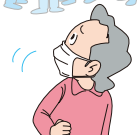
無用に入混みに入らない