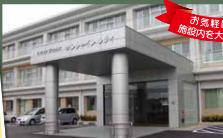
介護老人保健施設 サンシャインシティ

10月 20日(日) 14:00~16:00 ・ 21日(日) 10:00~16:00