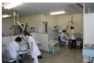
指導医の指導のもと矯正臨床の研鑽