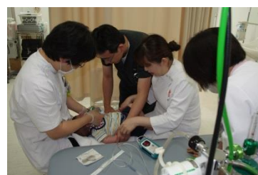
唇顎口蓋裂治療のチームアプローチ

上記のポリシーのもと、本分野では、公益社団法人日本矯正歯科学会の認定医の取得を目指し、入局後の指導から実際の認定医申請までを強力にサポートしています。認定医を取得するためには、 日本矯正歯科学会の5年以上の会員歴があり、矯正歯科基本研修および矯正歯科臨床研修が修了していることが必要 になります。本分野は、 両方の研修を行うことができる施設に認定されております 。また、申請に必要な症例の分析、診断、治療、保定までを細かく指導しており、治療開始前の症例検討会や治療終了症例への発表を通して申請に必要な症例をまとめていくことができます。このようなシステムが体系的に構築されており、当分野の2001年以降の認定医新規申請者の合格率は100%です。ぜひ私達と一緒に勉強しましょう！